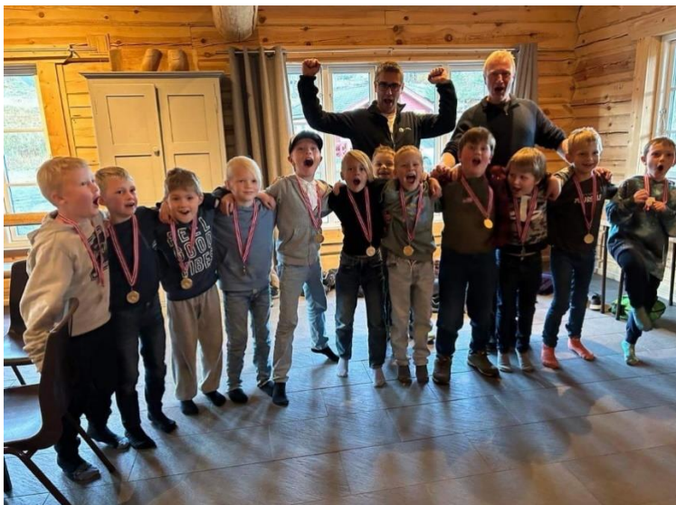
Gutter 8 år