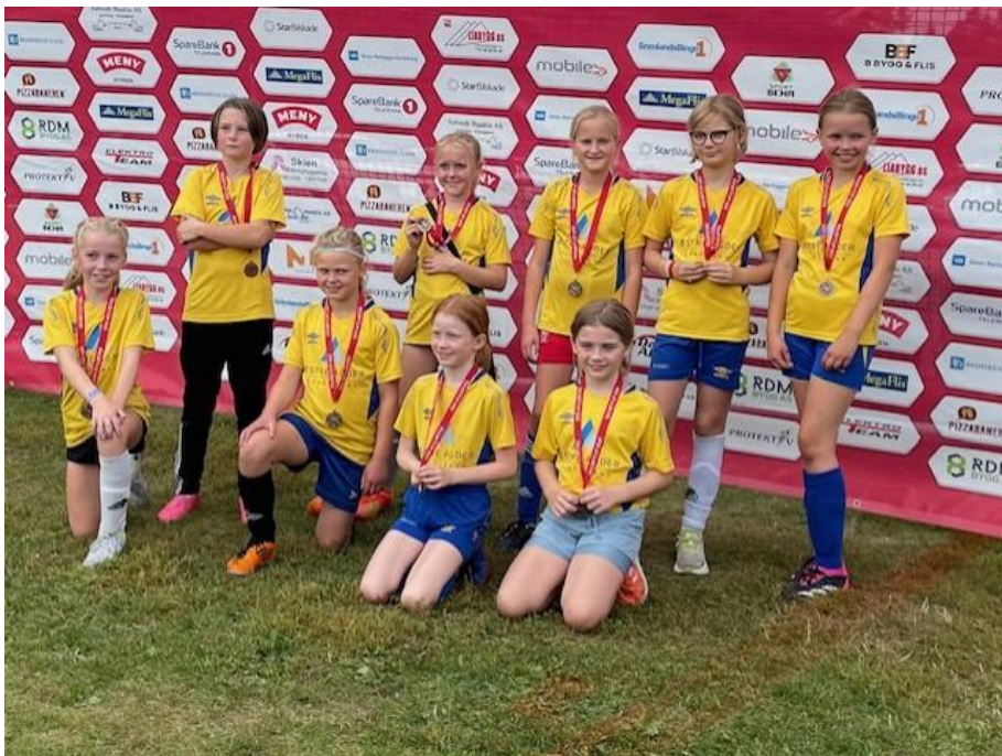
Jenter 9/10 år