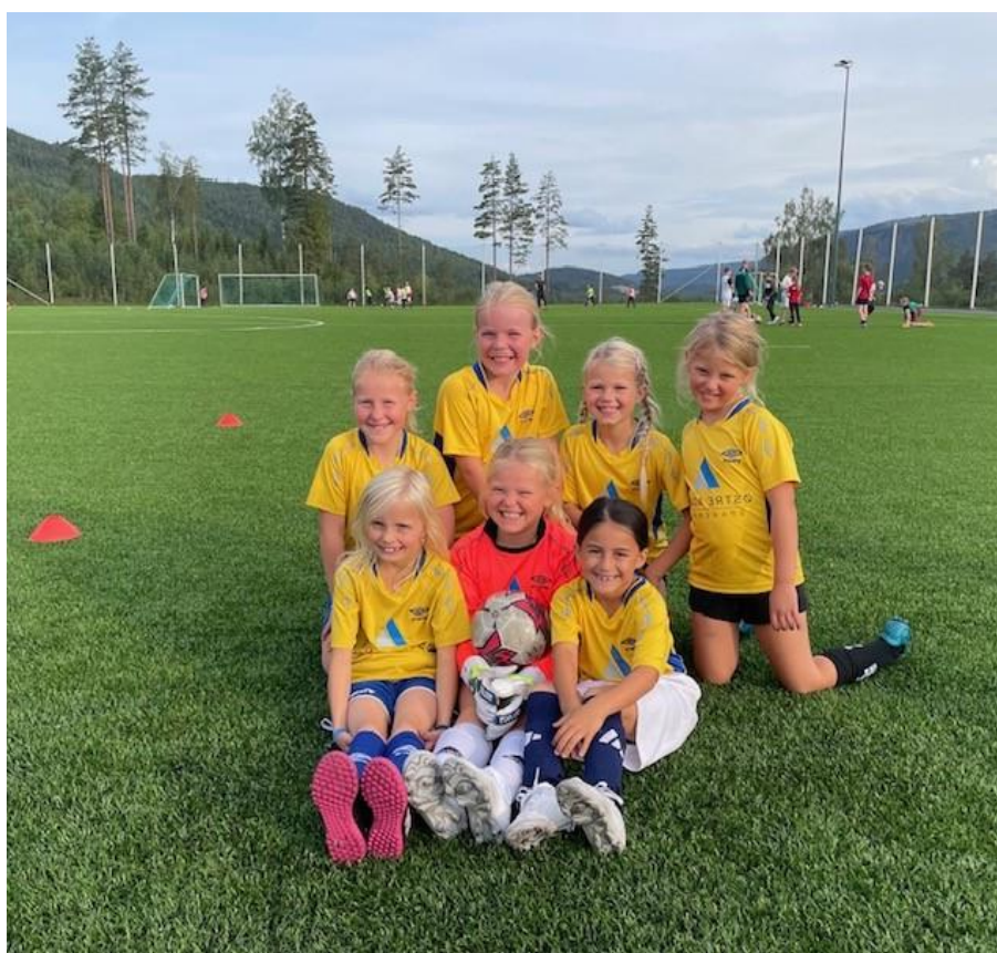
Jenter 8 år