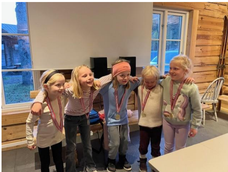
Jenter 7 år